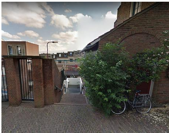
St. Stevenskerkhof - Google Street View 2016

De mogelijkheden om een openbare ruimte in de directe omgeving van de St. Stevenstoren te vernoemen naar de persoon die aan de herschepping van dit monument verbonden is, zijn beperkt. De verbinding tussen het St. Stevenskerkhof en Achter de Smidstraat is hiervoor een geschikte locatie.